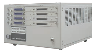
信頼性評価システム MIG-8600B