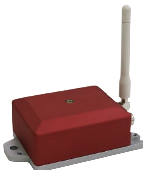
ワイヤレス構造ヘルスマニタリングシステム HM-5013