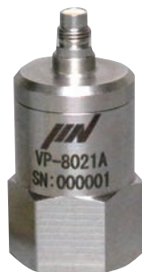
超小型振動ピックアップ VP-8021A