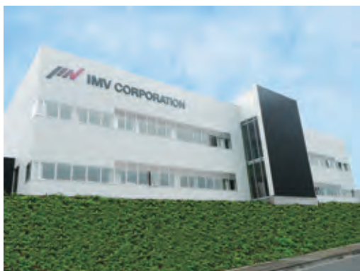
東京テストラボ 上野原サイト 高度試験センター